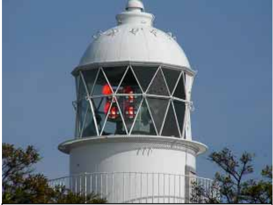
灯籠内で光るLU-M型灯器 (10秒周期で1回転します。) 平成14年9月15日に新替しました。