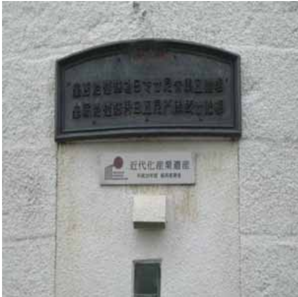
近代産業遺産認定書、認定プレート