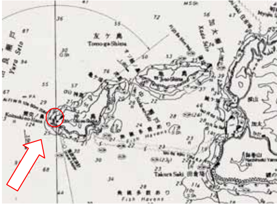
友ヶ島灯台の光り方(見え方)